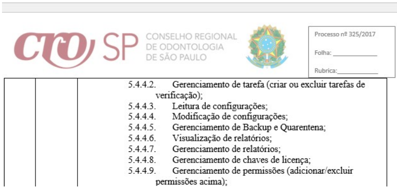
Figura 9 - Trecho retirado do referido documento com o mesmo descritivo do processo em questão

O nível de similaridade dos textos é muito grande, tendo os itens acima como destaque, porém todos podem ser comparados e correlacionados facilmente.