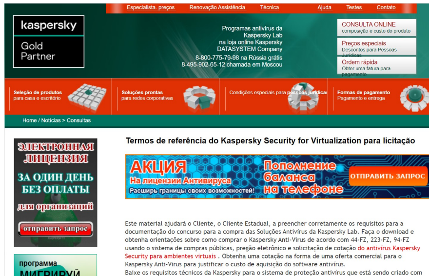
Figura 12 - Página de parceiro da Kaspersky com itens do Termo de Referência da Prodam