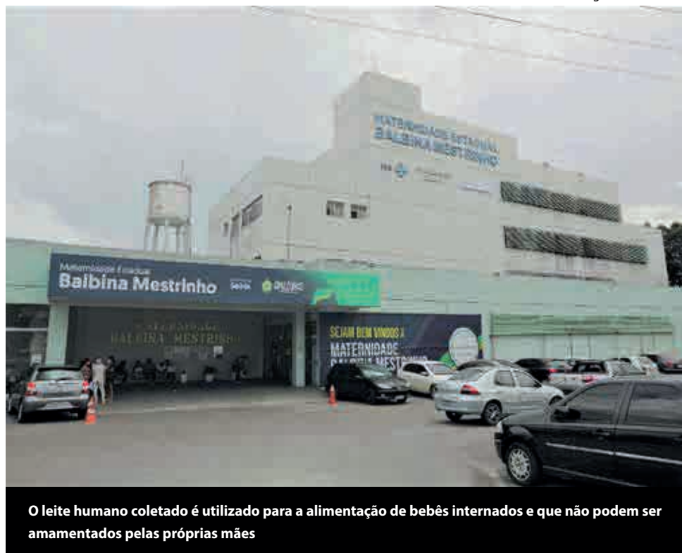
O leite humano coletado é utilizado para a alimentação de bebês internados e que não podem ser amamentados pelas próprias mães

As lactantes que procurarem a unidade, serão recebidas em um espaço decorado com tema natalino. A campanha especial segue até