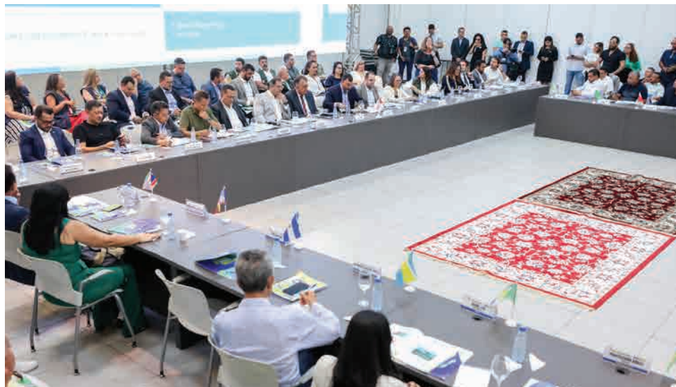
De forma inédita, o Programa de Fortalecimento e Repactuação da Saúde no Interior vai ampliar participação do Estado na saúde dos municípios com verbas estaduais

A distribuição dos valores de contrapartida do Estado obedece às diretrizes do Programa